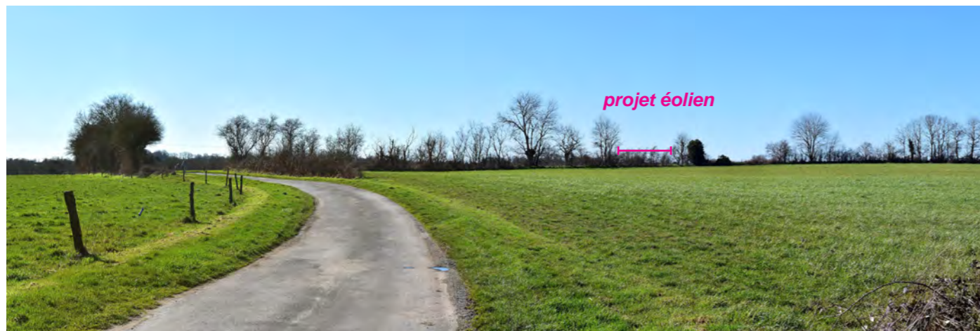
Photographie 154 : Depuis les hauteurs du coteau ouest du Dolo, entre Bressuire et Voultegon, le projet est largement filtré par la végétation, difficilement perceptible depuis la Voie verte 2.

Si la topographie permet régulièrement des visibilitées théoriques vers le projet, la végétation dense et des talus bordant l'ancienne voie ferrée tendent le plus souvent à refermer les perceptions. Lorsque les abords sont ouverts, la végétation distante masque souvent une partie notable des éoliennes. L'impact est très faible.